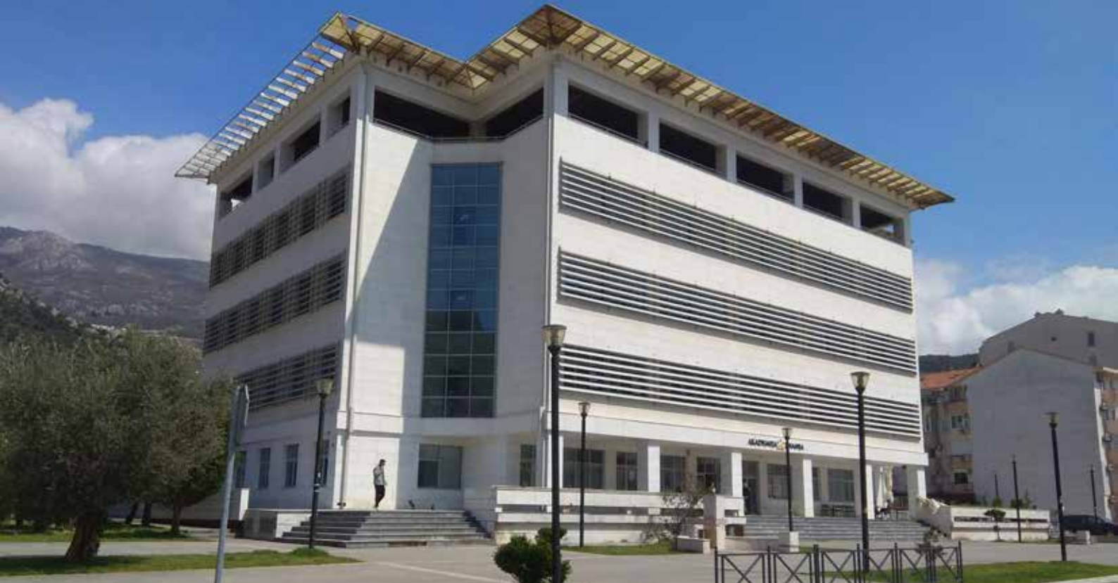
Confrence Hall Budva (KC)