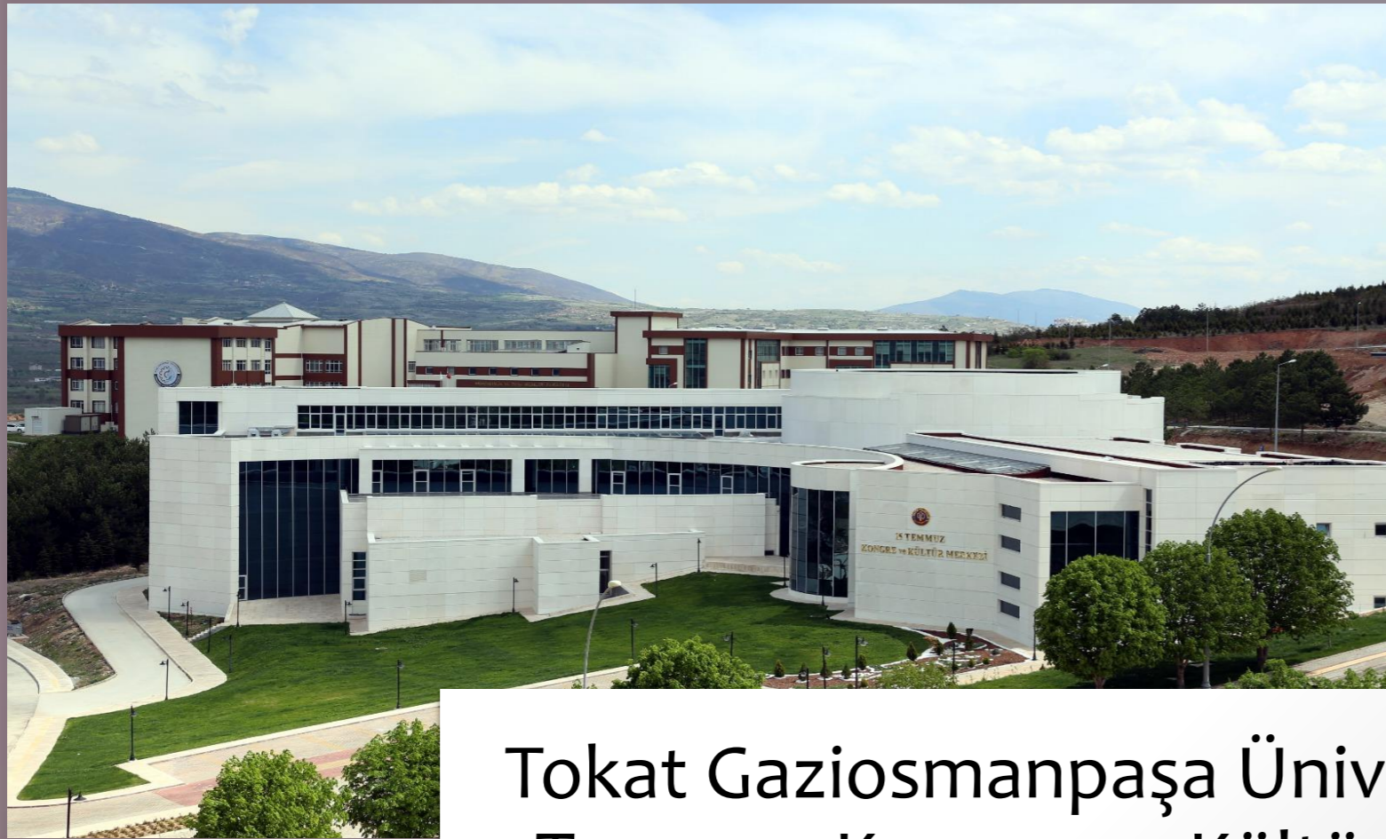
Tokat Gaziosmanpaşa Üniversitesi 15 Temmuz Kongre ve Kültür Merkezi