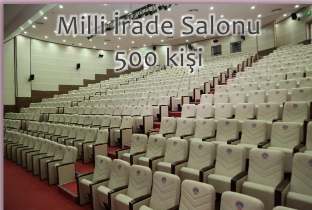
Milli İrade Salonu 500 kişi