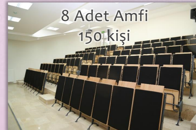
8 Adet Amfi 150 kişi