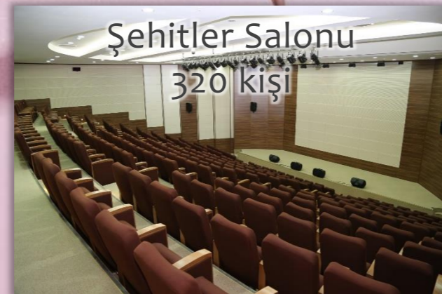
Şehitler Salonu 320 kişi